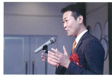
△飯田より開会の挨拶