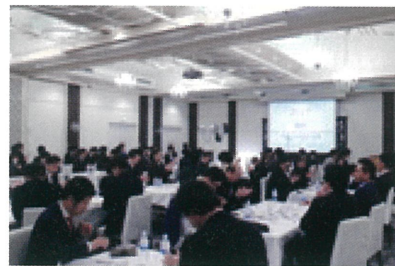
△ご参加ありがとうございました

その理由は、「私たちが本当に実現し、お客様に提供したいことは何か」を考えた際に出てきたことが「お客様の成長の促進」だからです。そこで、今回は「広く」よりも「深く、濃く」を意識し、弊社のクライアント様限定で開催しました。弊社のCBM理論に基づき、クライアント企業様同士の「社外の関係の質」そして「社内の関係の質」を高めることで、企業成長に向けた更なるシナジーを生み出したいとの想いで開催いたしました。他業種の会社様とディスカッションをしながら、自社を振り返る場としてご提供させていただきました。